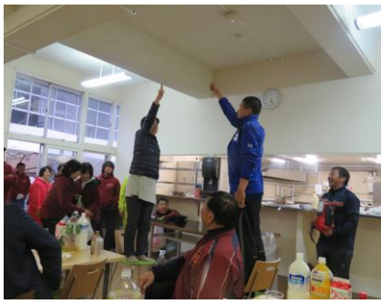
激励会じゃんけん大会

交流会は場所を移して市内のホテルで行われ、後援会会員と保護者の方々がビンゴゲームなどをしながら懇親を深めました。