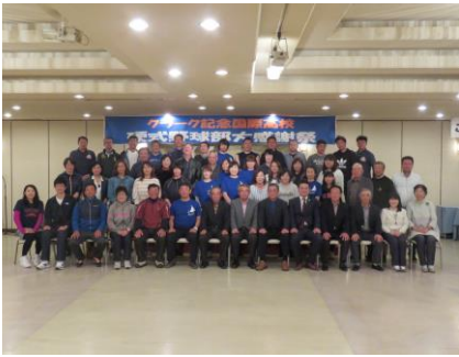
交流会で記念撮影

野球部情報は、クラーク記念国際高等学校のHP「スポーツコース・硬式野球」( http://www.clark.ed.jp/hokkaido/baseball/ )に掲載されています。